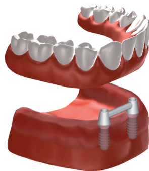
Titanium staaf bevestigd tussen de implantaten in de onderkaak.